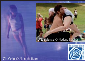
Cie Cello