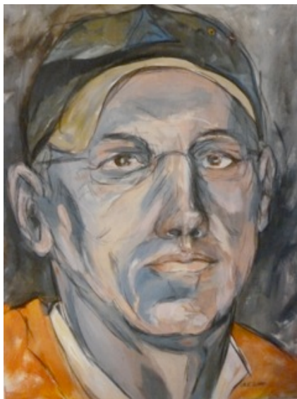
“Der Segelflieger” Acryl auf Leinwand 60x80 cm