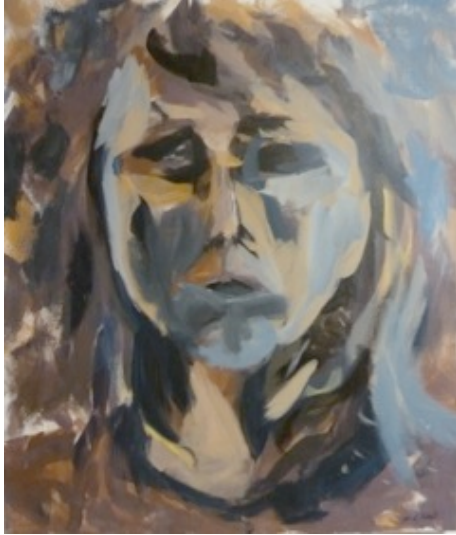
“Selbstportrait” Acryl auf Leinwand 60x70 cm