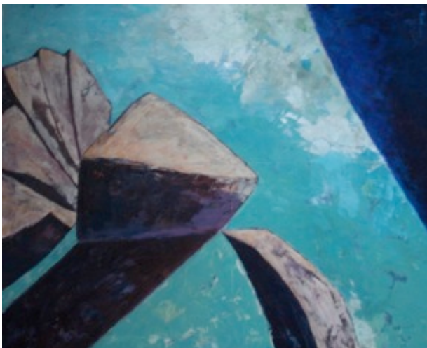
“Kraftfeld” Acryl auf Leinwand 80x100 cm