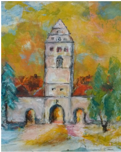
“Hohentor von Bad Neustadt” Acryl, gerahmt 50x70 cm