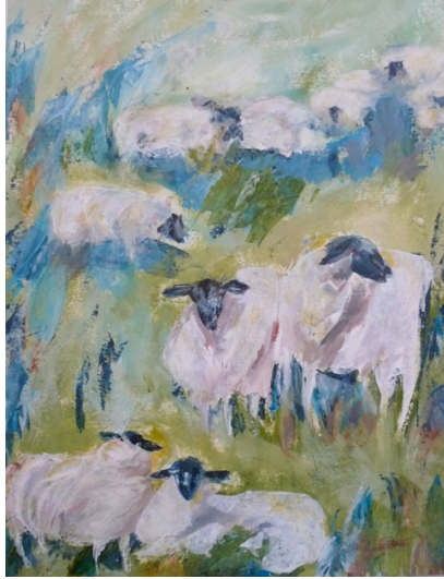
“Rhönschafe (Schwarzkopfschafe)” Acryl, gerahmt 50x60 cm