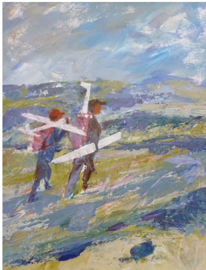
“Modellflieger (Wiege des Segelflugs)” Acryl, gerahmt 50x60 cm