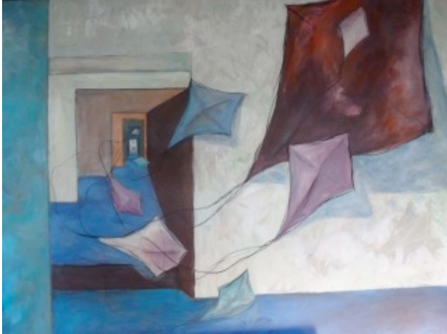
“Freier Raum Acryl auf Leinwand 80x120 cm