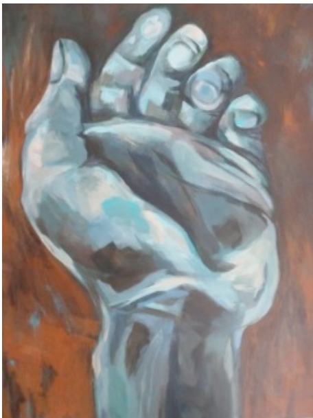
“Geben und Nehmen“ Acryl auf Leinwand 60x70 cm