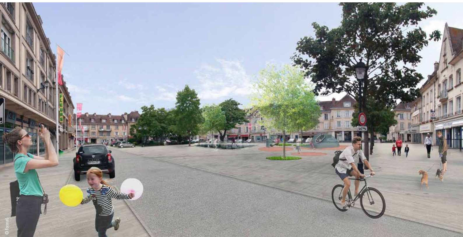
La Place Belle-Croix revisitée dans le cadre du projet de réaménagement du centre-ville.