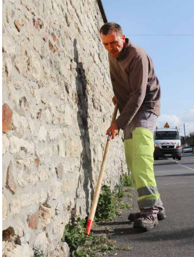
Devant les propriétés communales, comme ici devant la salle de musculation, c'est toujours le Service Jardins et Espaces verts qui intervient.