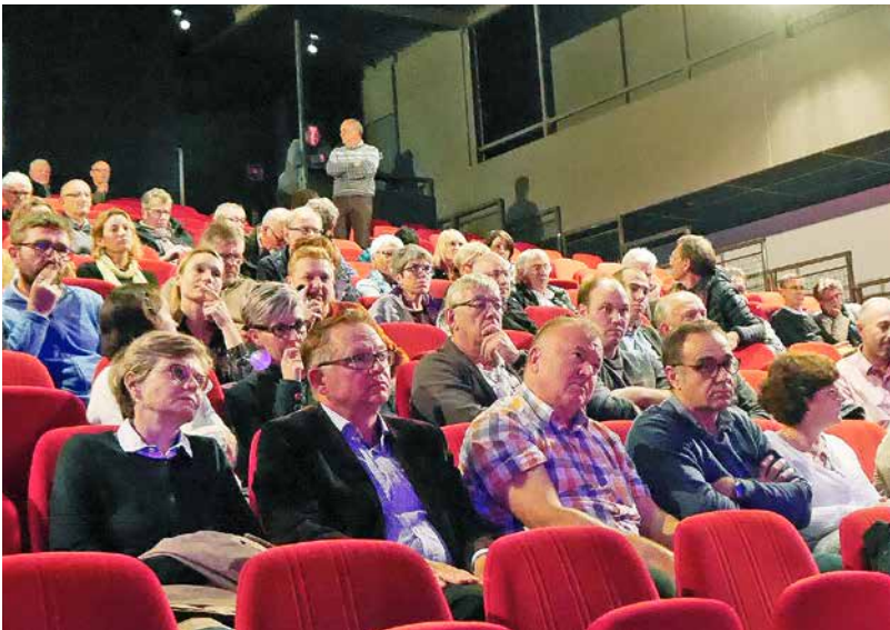
Le projet d'aménagement a été présenté aux Falaisiens lors d'une réunion publique en octobre dernier.

Notre objectif est de séduire tout le monde, d'être attractif pour les Falaisiens et les habitants du Pays de Falaise comme pour les touristes. Il s'agit véritablement de ramener le maximum de convivialité dans le centre-ville avec des rues commerçantes agréables à arpenter, une place Belle-Croix plus animée et un flux de visiteurs irriguant les commerces.