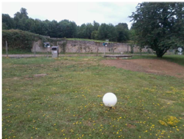
Regards d'arrivée ZI et Ville