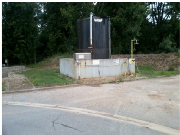
Stockage de chlorure ferrique