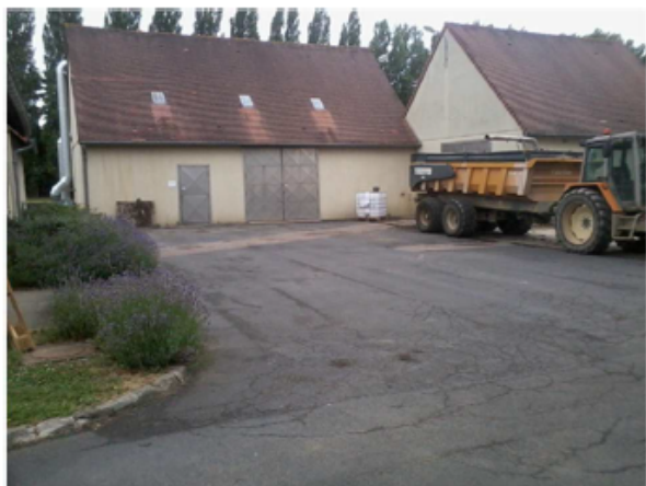
Locaux de prétraitement et des boues