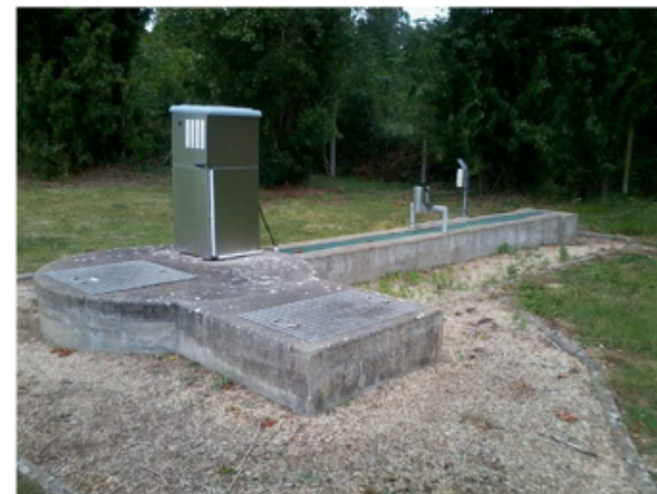
Canal de mesure des rejets d'eaux épurées