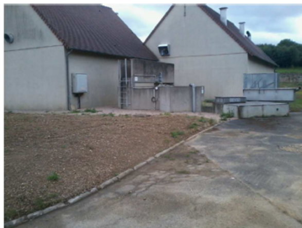
Dessableur - dégraisseur