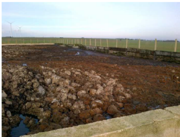
Stockage des boues